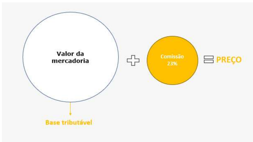
Figura 3. Exemplo prático da solução proposta: exclusão da base de cálculo